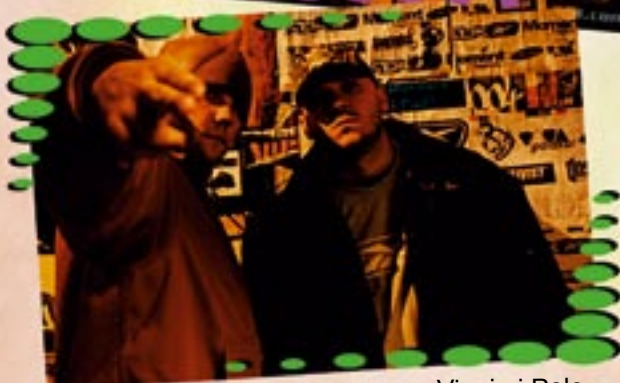
Vienio i Pele